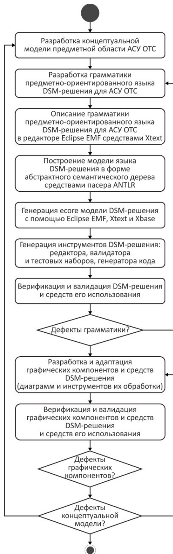
Рис. 2. Этапы методики разработки DSM-решения

При разработке концептуальной модели предметной области АСУ ОТС были использованы задачно-ориентированная онтологическая парадигма [21] и модель архитектуры Захмана [6]. В соответствии с задачно-ориентированной онтологической парадигмой в качестве корневого понятия данной модели определена «Функция АСУ ОТС». В соответствии с моделью архитектуры Захмана описание каждой функции должно содержать ответы на следующие вопросы: кто является органом управления, кем (чем) управляет орган управления, с какой целью осуществляется управление, как осуществ-