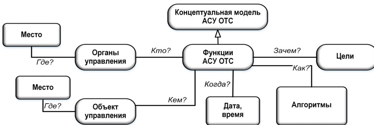
Рис. 3. Состав и структура концептуальной модели АСУ ОТС

вляется управление, когда и где реализуется данная функция. Таким образом, основными понятиями концептуальной модели АСУ ОТС являются: функции управления (ФУ), цель (Ц), алгоритм (А), орган управления (ОрУ), объект управления (ОбУ), место, дата и время. Состав и структура основных понятий концептуальной модели АСУ ОТС представлены на рисунке 3.