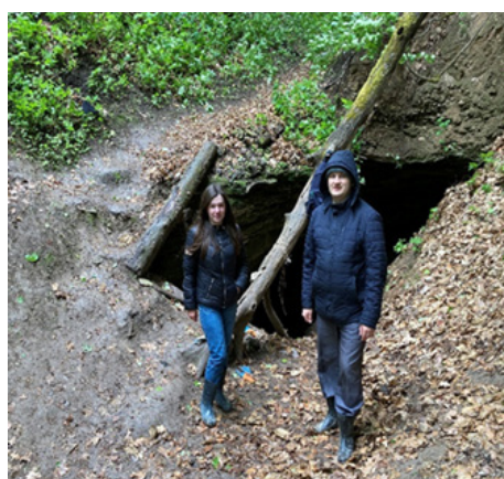
Рис. 4. Юрьевская пещера.

Пещера изобилует многообразием гипсовых слепых колодцев глубиной до 4 м и диаметром до 0,5 м, гипсовыми останцами, напоминающих сталактиты, и выступами в форме прилавок, нависающих на разной высоте над дном. На стенах поблескивают красноватые и кремевые натёки, мерцают крошечные сталактиты, а потолок похож на ночное небо, усыпанное звездами. В течение года температура в пещере неизменна и составляет около +7 °С.