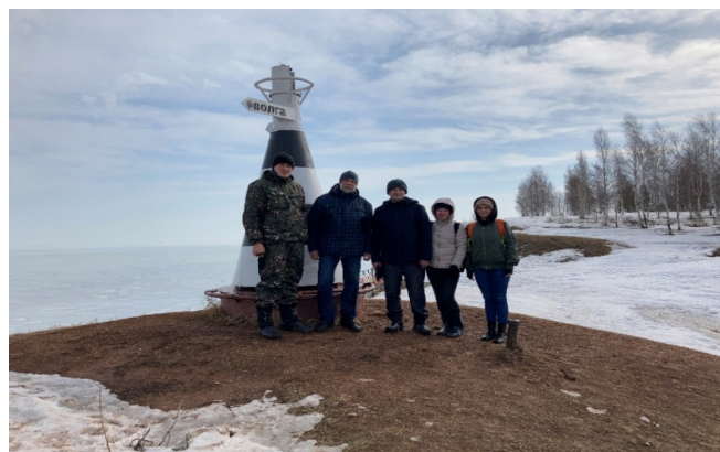
Рис. 3. Смотровая площадка горы Лобач.

бе. Гора Лобач находится на слиянии двух крупнейших рек Восточно-европейской равнины – Волги и Камы и является ландшафтным заказником, площадью 241 га и абсолютной высотой 136 м. [3]. Находясь на данной точке учитель – экскурсовод повествует о том, что гора является известковым останцом, а на прилегающих волжских обрывах по обе стороны от горы выступают коренные породы пермского периода (загипсованные доломиты, известняки, мергели и аргиллиты). Территория волжского берега в этом месте значительно осложнена многочисленными оползнями. На территории смотровой площадки горы установлен визуально напоминающий маяк указатель. Стрелы указателя направлены на две крупнейших реки – Волгу и Каму, которые сливаясь образуют акваторию, шириной до 42 км. Необыкновенные пейзажи и природные достопримечательности делают это место чрезвычайно привлекательным для школьников.