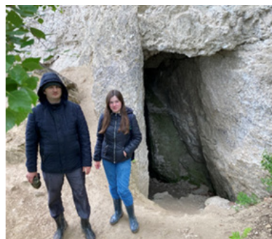
Рис. 5. Гипсовые штольни.

добываемый на этой территории характеризовался высоким качеством и отправлялся на производство вяжущих материалов и изготовления строительных изделий.