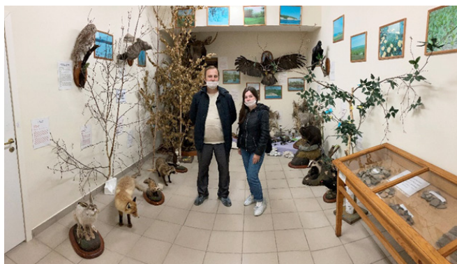
Рис. 2. «Зал природы» в краеведческом музее.

В рамках данной тематической экскурсии особую ценность представляют такие материалы музея как челюсти мамонта, которые найдены близ села Антоновка. В экспозиции музея существует целая коллекция Камско-Устьинских гипсов, добытых из рудника середины прошлого века. Представленные экспозиции наглядно показывают особенности геологической истории данной территории. Ориентировочное время экскурсии 30 мин.