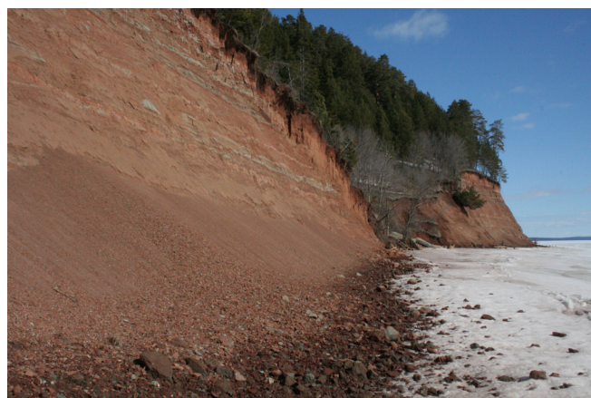
Рис.1. Осыпь шлейфа подножья. Воткинское водохранилище.

По нашим данным, отступление осыпных склонов берегов Воткинского водохранилища за весну составляет примерно 70-75% годового итога. Такая высокая интенсивность обусловлена морозным выветриванием. В марте-апреле непокрытые снегом крутые склоны хорошо прогреваются, в ночное же время устанавливаются отрицательные температуры. Другие максимумы развития процессов осыпания могут проявляться в разные месяцы летне-осеннего периода и совпадают в основном с пиками выпадения осадков. Из хода прочих метеорологических элементов наибольшее значение имеют колебания температур, ветровой режим и характер облачности. Минимум осыпания в тёплое время года наблюдается при устойчивой сухой жаркой безветренной погоде. Зимой склоны стабилизируются. Это хорошо видно по разрезам толщ снежного покрова у подножий осыпных склонов. В них практически отсутствует осыпной материал. В лучшем случае можно обнаружить редкие отдельные обломки или незначительные тонкие прослойки мелкозёма.