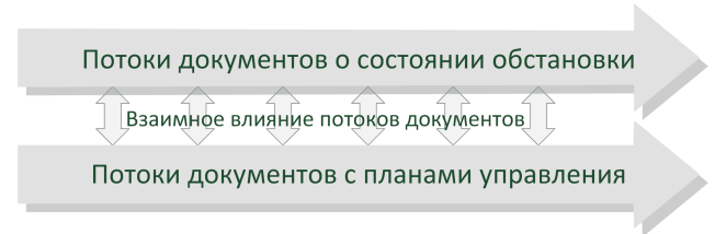
Рис. 3. Вольтерровская схема взаимодействия между потоками

Модель взаимодействия описывается системой нелинейных уравнений: