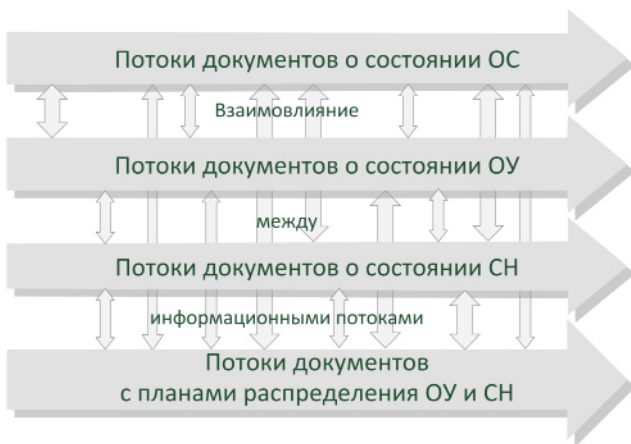
Рис. 1. Общая схема взаимовлияния между информационными потоками системы управления

Исходя из задачи оптимального формирования кон-