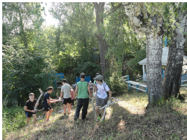
Рис. 1,2. Благоустройство родника «Богомольный» в 3 км от с. Тушна.