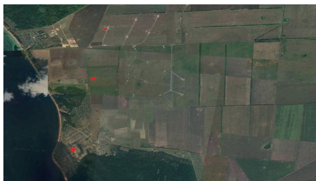
Рис.1. Места сбора исследуемых образцов почвы [11].

Объектом исследований послужили почвы ветропарка на территории с. Красный Яр Чердаклинского района Ульяновской области. Забор почвенных проб производили в центре села, на его окраине и, конечно, вблизи самих ветрогенераторов. На рисунке (рис.1) отмечены точки сбора исследуемых образцов почвы.