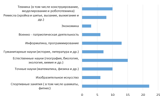
Рис. 2. Предметная область, к которой у обучающегося проявляется особый интерес (% обучающихся).

Подтверждением того, что дополнительное образование должно быть многофункциональным, является спрос на актуальную предметную область, к которой у обучающихся проявляется особый интерес. (рис.2). Анализируя данные, актуальными и востребованными предметными областями являются спорт (22% обучающихся из числа опрошенных), естественные науки (15%) и информатика (13%). Предметными областями, к которым у обучающихся не проявляется особого интереса, являются экономика (3%), изобразительное искусство (6%) и военно-патриотическая деятельность (6%).