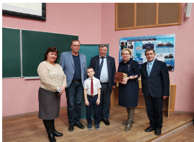
Рис. 3. Участники проекта на общем собрании Ульяновского областного отделения Русского географического общества, 2022г.

Академику Трешникову А.Ф. присвоено звание «Почетный гражданин Ульяновской области» (посмертно). Его имя занесено в «Золотую книгу Почёта Ульяновской области».