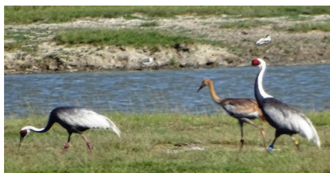
Рис. 5. Даурский журавль с кольцом оз. Аягын-нуур. 3.08.2021 г.

Небольшое мелководное озеро Аягын-нуур является местом гнездования большого числа видов водно-околоводных птиц, в зарослях плотно заросших тростником, их здесь больше, чем на озере Гун галуут. Так, 3.08.2021 г. были встречены 2 пары лебедей-кликун (одна с 4 птенцами и с 3 птенцами), пара огарей с 14 птенцами и пара даурских журавлей с пуховым птенцом (рис. 3). На этом небольшом мелководном озере Аягын-нуур достоверно гнездятся лебедь-кликун, огарь, даурский журавль и ходулочник. Наблюдалось, что в первый декаде в этом районе начинаются осенние миграции колпицы, журавля красавки, шилоклювки, белокрылой крачки и речной крачки. На озере Аягын-нуур 3.08.2021 г. нами отмечена одна пара даурских журавлей, из них одна особь с кольцом, но это кольцо не монгольского происхождения (рис. 5).