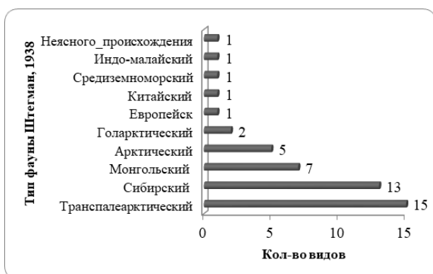
Рис. 2. Типы фауны оз. Гун галуут, Аягын-нуур и Багагун.

Озеро Гун галуут расположено более чем в 10 км к северо-западу от р. Хэрлэн, здесь многие водоплавающие птицы останавливаются во время осеннего миграционного периода. В первой декаде сентября 2020 г. в осенних предмиграционных скоплениях учтено более 230 особей серых уток и 130 особей красноголовых нырков (рис. 3).