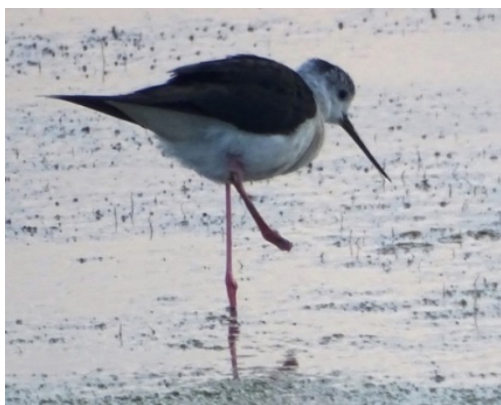
Рис. 4. Ходулочник ( Himantopus himantopus) на озере Гун галуут. 3.08.2021 г.

На озере Гун галуут достоверно гнездятся лебедь-кликун, огарь и пеганка: 3.08.2021 г. отмечена пара лебедей-кликун с взрослыми 5 птенцами, 2 пары огаря – с 28 птенцами, пара пеганок – с 15 птенцами, и белохвостый песочник – с одним птенцом. Один взрослый и молодой сухонос отмечены 4 августа на северо-восточный край оз. Гун галуут, куда они перелетели на кормление. На этом озере отмечена одна пара ходулочника ( Himantopus himantopus ), 3.08.2021 г. отмечена птица со сломанной ногой (рис. 4).