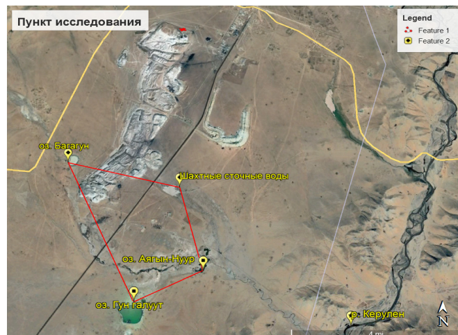
Рис. 1. Схематическая карта расположения исследуемых водных объектов. Работа Н. Мягмарсурэн.

но около 18 км юго-западнее центрально района Багануур и южнее 3 км от угольной шахты. Координаты обследованной территории: 47°38'1,52"с.ш, и 108°17'56"в.д. Озеро минеральное, площадь 0,8 км 2 , длина – 1,2 км, ширина – 1,0 км, длина береговой линии – 3,4 км, максимальная глубина – 1,2 м, высота над у.м. 1323 м [4]. Физико-географическая характеристика этой территории дана в работах Батчулуун (2020) и Звонова (2016). Обследованная территория находится в физико-географическом подрайоне Среднегорья на юге и востоке от Хэнтэйского хребта [1, 2].