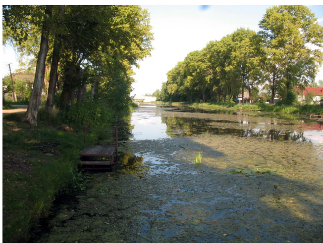
Рис. 2. Зарастание акватории Старо-Тверецкого канала, 2021 г.

В последнее десятилетие отмечаются признаки ускоренной евтрофикации и зарастания русловых и прибрежных экосистем городских рек и каналов на фоне снижения их проточности и сокращения сброса воды через Старо-Тверецкую плотину в р. Тверцу. В наибольшей степени эти процессы характерны для Старо-Тверецкого канала, проективное покрытие водной растительности которого за период 2014-2021 гг. увеличилось с 50-60% до 80-100% акватории (рис. 2).