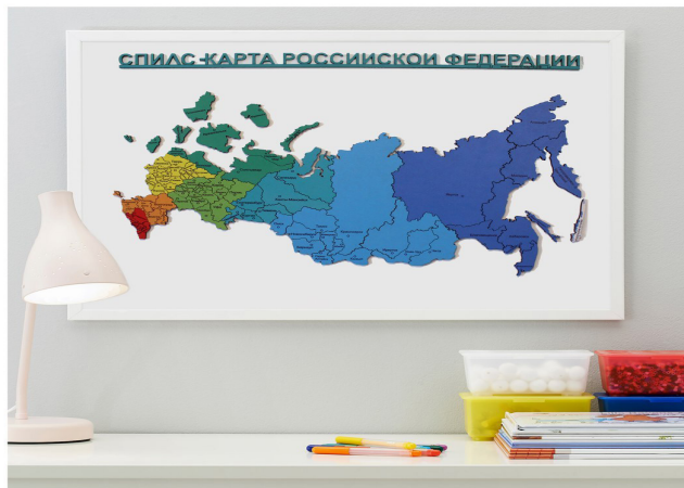
Рис. 1. Спилс-карта России в цветовом варианте.

Использование спилс-карт на уроке географии решает дидактические задачи, а именно, позволяет учителю облегчить запоминание географической номенклатуры за короткое время. Немаловажно и то, что пособие может быть использовано при проведении занятий после уроков во внеурочной деятельности, а также при выполнении домашнего задания с родителями.