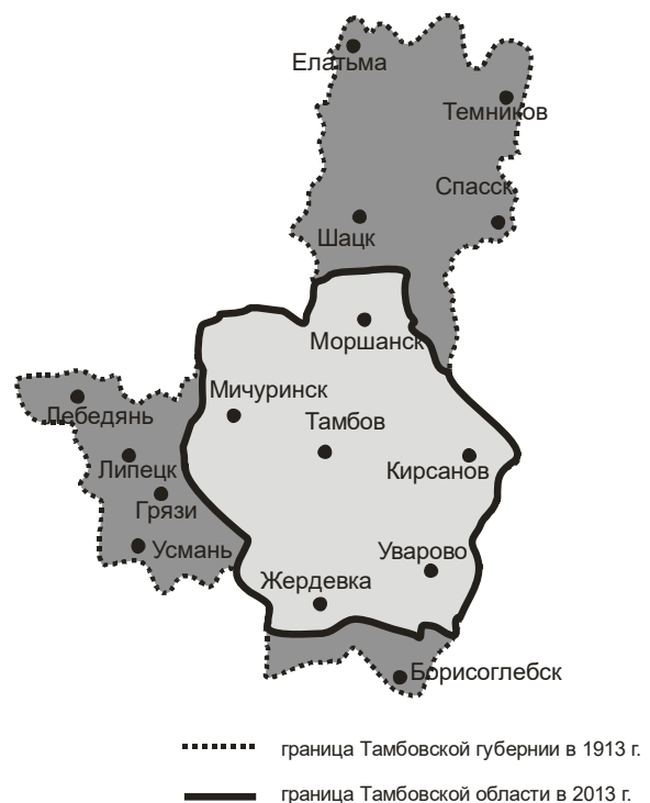
Рис. 2. Совмещенные границы Тамбовской губернии и Тамбовской области.

В Тамбовской области количественная динамика тесно связана с территориальной трансформацией (Рис. 2). Кратко рассмотрим хронологию указанных изменений.