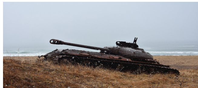
Рис. 2. Танк ИС-2, 1945 г.

На этом участке расположены достопримечательности военного характера – танки ИС-2 и ИС-3 (ИС - Иосиф Сталин, 4С-3М, 1945 г.) (рис. 2). Это заброшенная рота танковых огневых точек: машины находятся в маскировочных углублениях в грунте, соединены траншеями друг с другом и с хозяйственными и обслуживающими сооружениями.