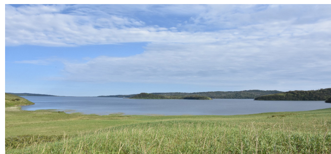
Рис.3. Озеро Песчаное.

С вершин песчаных дюн открывается прекрасный вид на Кунаширский пролив и Серноводский перешеек. Далее маршрут проходит к побережью озера Песчаное (рис. 3), где можно встретить кормящегося японского журавля (данный вид занесен в Красную книгу РФ).