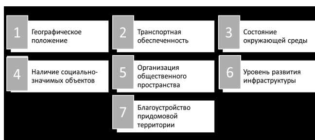
Рис. 1. Группы показателей качества городской среды.

Индекс – показатель качества окружающей дом среды в форме числа. Такая его форма позволяет легко сопоставлять разные варианты домов, облегчая потенциальному покупателю выбор. Чем значение Индекса больше, тем комфортнее вам будет жить в вашем будущем доме. Индекс – агрегированный показатель, складывающийся из 35 частных показателей, объединенных в 7 подгрупп (рис. 1).