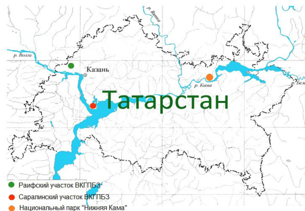
Рис. 1. Районы исследований.

Долинами Волги и Камы территория республики Татарстан делится на три природных области – Предволжье, Предкамье и Заволжье [4, 5]. Исследования проводили на территории Волжско-Камского государственного природного биосферного заповедника (Раифский и Саралинский участки ВКГПБЗ) и национального парка «Нижняя Кама» в 2017–2021 гг. (рис. 1). Исследуемые участки располагаются в южной тайге Вятско-Камской возвышенности и лесостепной провинции Низменного Заволжья [5]. Согласно современной физико-географической литературе Раифский участок ВКГПБЗ расположен Западно-Казанском низменном районе с Восточноевропейскими сосновыми и широколиственно-сосновыми лесами на дерново-подзолистых и светло-серых лесных почвах.