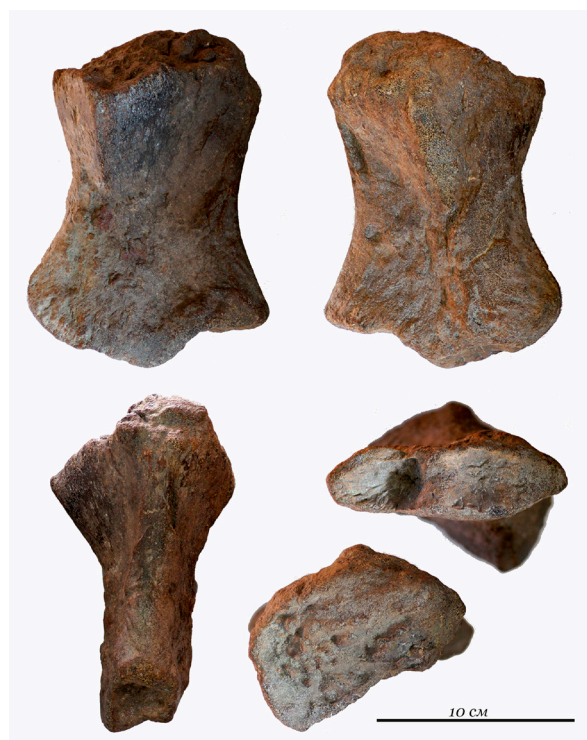
Рис. 1. Левая плечевая кость Arthropterygius lundi .

Наиболее интересный из найденных экземпляров - плечевая кость ихтиозавра вида Arthropterygius lundi (Рис. 1).