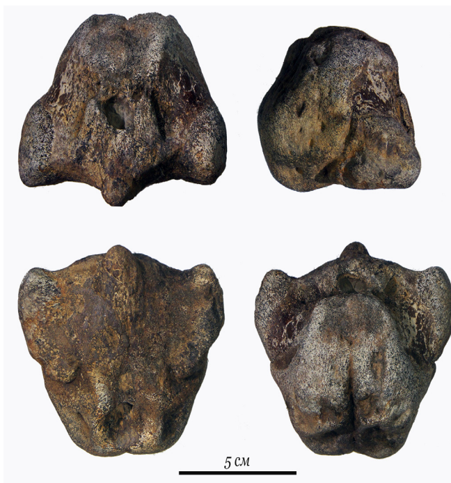
Рис. 3. Базисфеноид Grendelius sp.

Базисфеноид, отнесенный к роду Arthropterygius , характеризуется редуцированными базиптеригиодными отростками и характерно сдвинутым к заднему концу отверстием для внутренних сонных артерий, что является диагностическим признаком рода [8]. Базисфеноид, отнесенный к роду Grendelius , напротив, несет хорошо развитые и широко расставленные базиптеригиодные отростки, отверстие для внутренних сонных артерий на нем расположено близко к заднему краю, но открывается на вентральную сторону, что характерно для представителей данного рода [6, 7].