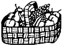
Схема-уловка — «Принести подарок»

Не важно, что у нас за окном — зима, осень или весна, Новый год или Рождество, День Святого Валентина или День работников лесной промышленности. Намеки, намеки, намеки... Коньячка бы, фруктов, какой-нибудь вкуснятины! Иногда даже дают пустую тару — мешочек с изображением Деда Мороза и Снегурочки. ©